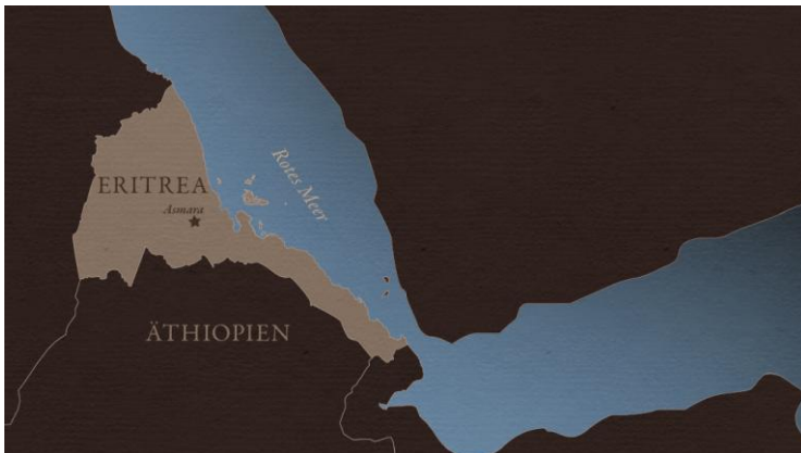
(Abb. Eritrea - grenzt an Äthiopien, den Sudan und Dschibuti sowie im Roten Meer an Jemen)

Eritrea, das Land am Horn von Afrika, ist der jüngste Staat Afrikas. Nach einem 30-jährigen Unabhängigkeitskrieg von 1961 bis 1991 wurde am 24. Mai 1993 nach einem von der UN überwachten Referendum der unabhängige Staat Eritrea ausgerufen. Wenige Tage später nahm die UNO das Land als 182. Mitglied auf.