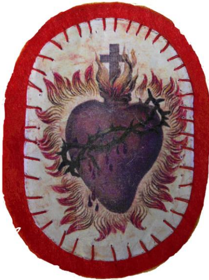
Abbildung des Heiligen Herzens, welches Awet von der Klosterschwester als Erinnerung mit auf den Weg gegeben wird.

„Die Herz-Jesu-Verehrung ist ein Ausdruck der katholischen Spiritualität bzw. Volksfrömmigkeit. Dabei wird Jesus Christus unter dem Gesichtspunkt seiner im Herzen symbolisierten Liebe verehrt.“